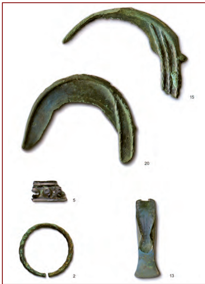
2 Armring 5 Bronzeblech verziert (Fragment) 13 Lappenbeil 15 Zungensichel ohne Nietloch 20 gut erhaltene Zungensichel

Die Existenz dieser Teile war bislang unbekannt. Der HGV gab die »Post« vertrauensvoll an den Aschauer Archäologen Dr. Werner Zanier weiter, der schon im Zusammenhang mit der Quellenbandedition zur