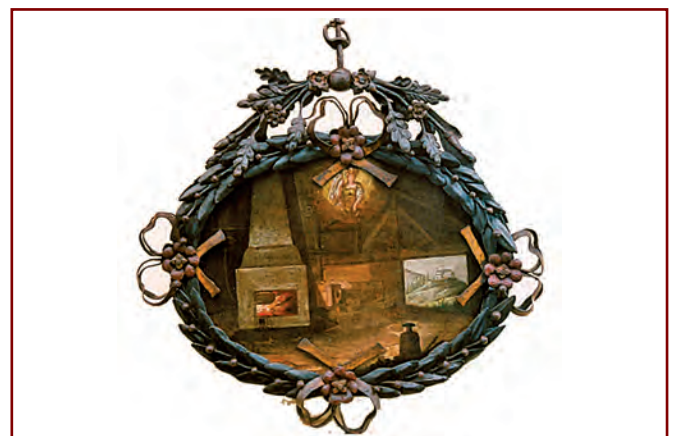
Innenansicht des oberen Hammers Hohenaschau