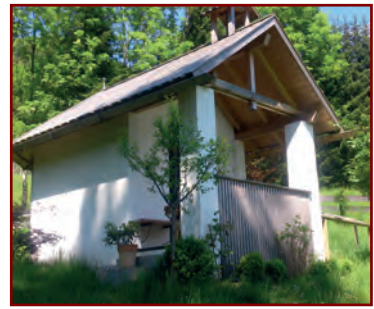
Links: Die seelige Irmengard mit Schutzmantel; Rechts: Die moderne, mit der Öffnung nach Osten gerichtete Privat-Kapelle oberhalb der Klinik „Sonnenbichl“ („Mutter-Kind-Kurheim“)