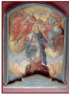
Links: Die frisch restaurierte Kapelle in Haindorf, 2006; Rechts: „Krönung Mariens“, um 1840

Kleine offene Feldkapelle von 1841. Altargemälde: Krönung Mariä, um 1840. Das Bauwerk konnte durch Spenden der Haindorfer Bevölkerung 2006 komplett restauriert werden.