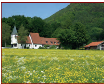
Auf dem Bild gut zu erkennen: Die Kirche, das Pfarrhaus und das evangelische Gemeindehaus

Das Gotteshaus wurde noch während des II. Weltkrieges, 1941, unterhalb von Schlechtenberg errichtet und Anfang der 1960er Jahre unter dem Architekten Olaf Gulbransson umgebaut und erweitert.