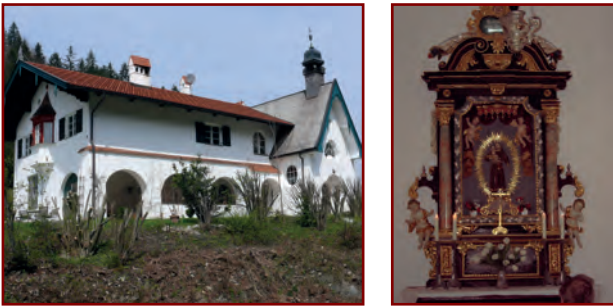
Links: Die Kapelle ist harmonisch in den Baukörper integriert; Rechts: Altar der Antonius-Kapelle: Barocker Säulenaufbau (Ende 17. Jhdt.), Mittelstück neubarock

Im Zusammenhang mit dem Schulhaus-Bau in Stein, 1908, von Theodor von Cramer-Klett nach Plänen des Münchner Architekten, Prof. Franz Zell (ebenso Burghotel und Forsthaus Grattenbach), erbaut. Neubarock ausgestattet. Heute in Privatbesitz.