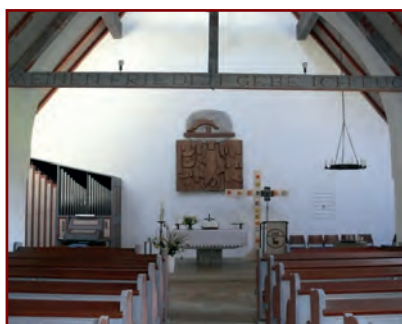
Innenansicht der „Friedenskirche“

Das Gotteshaus wurde noch während des II. Weltkrieges, 1941, unterhalb von Schlechtenberg errichtet und Anfang der 1960er Jahre unter dem Architekten Olaf Gulbransson umgebaut und erweitert.