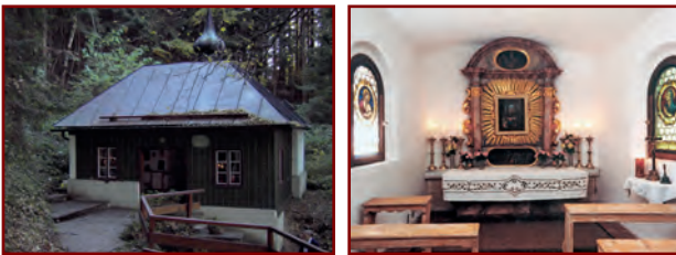
Links: Die idyllisch am Haindorfer Berg gelegene Abendmahlkapelle lädt ein zu Rast und Gebet; Rechts: In der Mitte des Altars die Darstellung des Hl. Abendmahls, ehem. Votivtafel von 1723

Im 17. Jahrhundert, bei einer als heilkräftig geltenden Quelle entstanden. Höhepunkt der Wallfahrt in der ersten Hälfte des 19. Jahrhunderts. Vorhalle und Aufbau des Türmchens 1877.