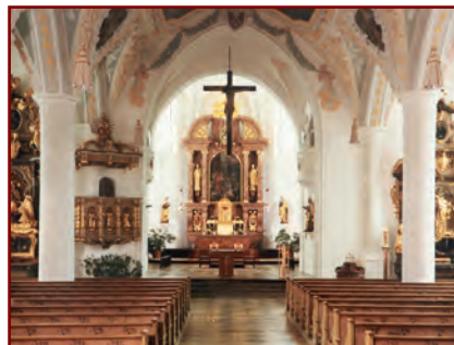
Innenansicht der Aschauer Pfarrkirche

Hauptkirche der Herrschaft Hohenaschau. Erstmals urkundlich im 12. Jahrhundert erwähnt, wohl als romantisches „Täuferkirchlein“ auf dem Felsen über der Prien errichtet. Mitte des 15. Jahrhunderts im Stil der Gotik als zweischiffiges Langhaus umgebaut und schließlich 1702 barockisiert. 1752/54 auf die heutige Größe erweitert. Seit 1680 Pfarrkirche.