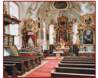
Links: Die Sachranger Pfarrkirche „St. Michael“; Rechts: An der reich stukkerten barocken Innenausstattung spürt man die künstlerische Hand der Graubündner Baumeister.

Erste urkundliche Erwähnung im Jahre 1400. Am 31.8.1689 Vollendung des von der Herrschaft Hohenaschau unter Graf Johann Maximilian II. von Preysing-Hohenaschau angeregten und geförderten barocken Umbaus (Stuckatur von Giulio und Pietro Zucalli). Seither im Wesentlichen unverändert – im Einklang von Architektur und Ausstattung. Hier wirkte Peter Huber ("Müllner-Peter") als Organist, Chorleiter und Kirchenpfleger. 1988/89 außen, 1990/91 innen restauriert.