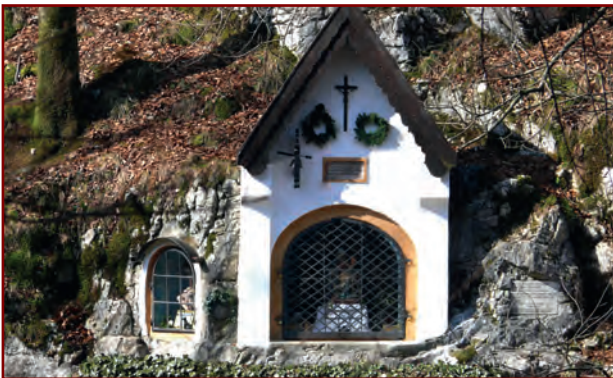
Die „Kettenkapelle“ von der gegenüber liegenden Seite der Prien-Klamm, fotografiert 2014