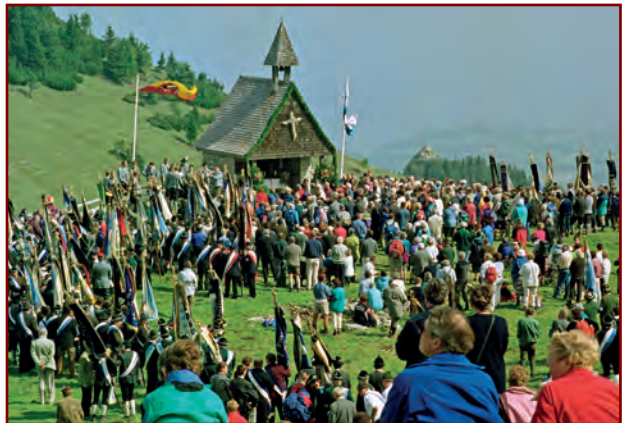
Berggottesdienst für die Gefallenen des Chiemgaus am letzten Samstag im August.