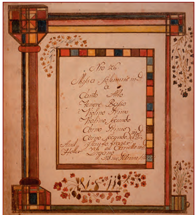
Notenblatt aus der Hand des Peter Huber von 1811

Schon recht bald muss er Freude an Musik und Musizieren verspürt haben. Sein Leben lang nutzt er sein herausragendes musikalisches Talent. Durch sein Wirken als Organist, Chorleiter, Arrangeur und Komponist prägt er Musik und Gesang in seiner Heimatgemeinde. Ein Großteil seiner schöpferischen Arbeit bleibt der Nachwelt im sogenannten »Sachranger Notenschatz« erhalten. Für seine künstlerische Neigung sprechen auch die hübschen Verzierungen auf vielen der gesammelten Notenblättern.