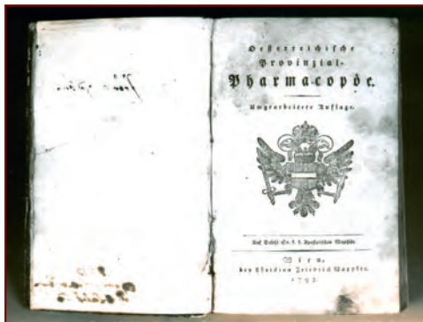
»Österreichische Provinzial Pharmacopöe« aus der Bibliothek des Peter Huber

Neben der Musik gilt seine Leidenschaft der Heilkunde. Als Tier- und Menschenarzt ist sein Rat weithin gefragt. Auf diese Fertigkeit verweisen vor allem zwei umfangreiche Handschriften mit Rezepturen* aus jener und längst vergangener Zeit sowie Einträge in den Sterbematrikeln und eine eigene Apotheke mit dazugehöriger Literatur in der Mühle.