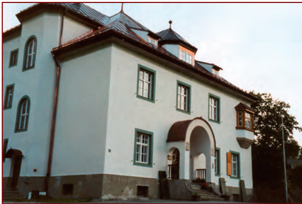
Das Müllner-Peter-Museum ist im 2. OG des 1910 errichteten Schulhauses in Sachrang untergebracht; Foto von 2001, Archiv HGV

Das Müllner-Peter-Museum wird von der Gemeinde Aschau i.Ch. zusammen mit dem Museumsverein Müllner-Peter-von-Sachrang eingerichtet und im September 2001 eröffnet. Es ist im Dachgeschoß des ehemaligen Schulhauses in der Schulstraße 3 untergebracht; das »Lehrer-Hickl-Zimmer« in der ersten Etage (Konzept siehe Seite 4!).