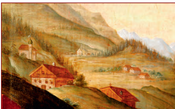
Die Einöden Grenzhub (links vorne) und Aschach (drei Häuser im Mittelgrund) bei Sachrang; links die Ölbergkapelle. Ausschnitt aus dem Altarblatt der Rupertuskapelle