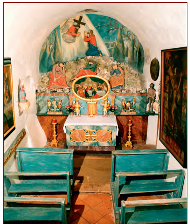
Innenansicht der Ölbergkapelle in Sachrang; Foto Berger, Archiv HGV

Ob der Unglückstod seiner Frau den Ausschlag gibt, die vom Verfall bedrohte Ölbergkapelle zu retten (erbaut im 17. Jahrhundert), ist nicht nachzuweisen.