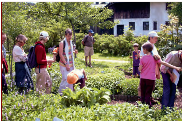
Gästeführung im Sachranger Heilkräutergarten

Im Zusammenhang mit der Ausstellung entsteht 1993 am Sachranger Schulhaus ein Heilkräutergarten. In ihm wachsen vor allem Pflanzen, die Peter Huber in seinem Rezeptbuch erwähnt und sicherlich selber angebaut oder genutzt hat. Der Garten bleibt auch nach der Ausstellung erhalten.