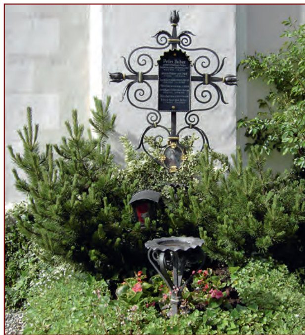
Das Grab Peter Hubers, links neben dem Eingangsportal der Sachranger Pfarrkirche St. Michael

9. (abgetrennt von o.a. Thematik) Lehrer-Hickl-Zimmer Schule auf dem Land (»Der Lehrer von Stein«, 1908-1927)