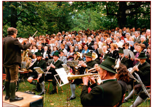
Chor und Orchester bei der Ölbergwallfahrt vor der Kapelle; 1992; Foto Berger, Archiv HGV

Wallfahrt am dritten Sonntag im September fester Bestandteil des kulturell-religiösen Lebens im Priental.