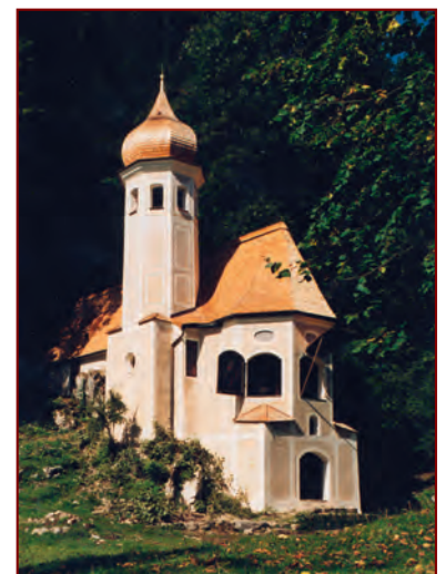
Die 1992 vom »Freundeskreis« renovierte Ölbergkapelle von Sachrang; Foto Berger, Archiv HGV

Fest steht nur, dass er und sein Bruder Thomas mit großem persönlichen und finanziellen Einsatz das Wallfahrtskirchlein an der Tiroler Grenze gründlich renovieren lassen. Im September 1827 wird es benediziert und die Tradition der Wallfahrt zum Ölberg in Sachrang lebt wieder auf.