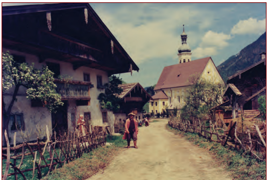
Das für die Dreharbeiten veränderte Ortszentrum von Sachrang

Dieser Film verbreitet die Müllner-Peter-Geschichte im ganzen Land.