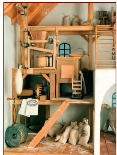
Modell (Ausschnitt) einer Getreidemühle, wie sie um 1800 auf dem Lande üblich sind; Modell: Hans Huber, Radlkofen; Foto Berger, Archiv HGV

1809 übernimmt er das elterliche Anwesen und die Getreidemühle im Aschacher Grund und geht seinem Beruf als Müller und Bauer nach.